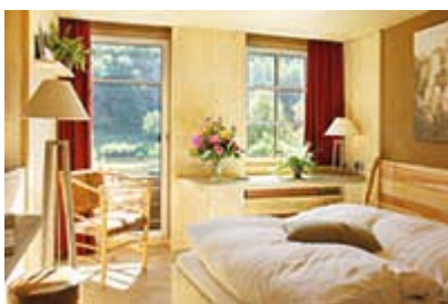
Interno camera dell'Helvetia Hotel con

Nel parco naturale della Svizzera Sassone si trovano formazioni rocciose, veri e propri monumenti della natura. La più famosa è la Bastei da cui si ammira il panorama più celebre di tutta la Svizzera Sassone. Si tratta anche dell'attrazione più turistica del parco, attraversata dal ponte in pietra Basteibrücke (1851), che ne permette la visita ai turisti. Da visitare nei pressi della Bastei c'è il sito archeologico Felsenburg Neurathen , che conserva ancora, scavate nella roccia, le stanze, le cisterne e i corridoi della più grande fortezza mai edificata nella Svizzera Sassone e risalente al 1200. Quello che resta del castello di Neurathen è oggi un museo a cielo aperto che offre magnifiche vedute su tutto il paesaggio della Svizzera Sassone. Inoltre, a circa 15 chilometri a est di Pirna si trova la montagna dalla cresta piatta più importante della Svizzera sassone: il Lilienstein . Le sue pareti rocciose sono perfette per le mani nude dei freeclimbers: anche il principe Augusto II Forte non resistette alla tentazione e un obelisco sulla cima del Lilienstein ricorda la sua scalata nel 1708. Ancora più suggestivo è vedere stagliarsi nel panorama le cime frastagliate dello Schrammsteine , special modo nei colori autunnali. Questo gruppo di rocce lunghe e dentellate sono situate a est di Bad Schandau e hanno molto da offrire ad escursionisti, scalatori e a chiunque voglia portarsi a casa il ricordo di paesaggi superlativi.