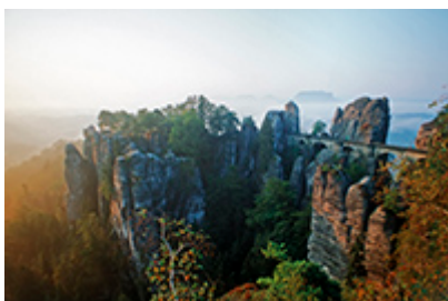
La Bastei e il Basteibrücke in autunno: attrazione principale del Parco Naturale della Svizzera Sassone.

Settembre e ottobre sono mesi di vacanze lente e rigeneranti nell'affascinante villaggio bio-resort Schmilka in Sassonia, a soli 30 km da Dresda. Punto di partenza ideale per avventurarsi sui mistici sentieri del parco naturale dei monti di arenaria, ammirare i foliage più belli della Germania e ripercorrere le orme dei pittori romantici. Il bio-resort Schmilka offre tante specialità culinarie di produzione organica e assicura notti tranquille negli alloggi di varia categoria arredati con cura nel rispetto dell'ambiente e della salute.