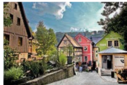
Scorcio del villaggio bio-resort Schmilka.