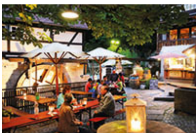
Biergarten Mühlenhof, cortile della locanda-birreria vicino al mulino nel centro di Schmilka.

Là dove 100 milioni di anni fa tutto era ricoperto da acqua, spazia oggi il lussureggiante Parco Nazionale della Svizzera Sassone con spettacolari montagne di arenaria, pareti di roccia vellutate e tondeggianti cime sinuose, irresistibile attrazione tutto l'anno per escursionisti e scalatori. Circa 1.200 chilometri di sentieri segnalati conducono attraverso un paesaggio che sembra primordiale fatto di foreste, strette gole e luoghi mistici da cui si schiudono viste panoramiche mozzafiato. Per trascorrere delle rilassanti e dorate vacanze autunnali nel cuore del Parco Nazionale della Svizzera Sassone, una meta davvero speciale è il Bio und Nationalpark-Refugium Schmilka , un piccolo villaggio appartenente al distretto di Bad Schandau, adagiato sulla riva destra dell'Elba, che nel 2017 è stato premiato tra i "Borghi più belli della Sassonia" .