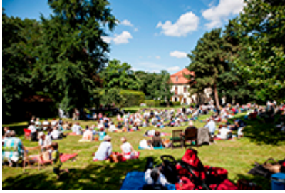
Pic nic nel parco del castello di Proschwitz