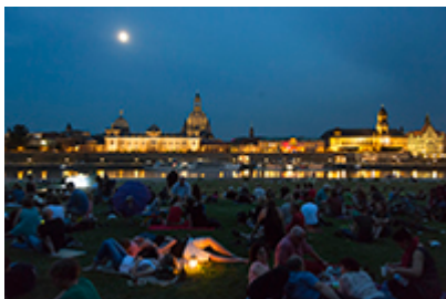
Notte a Dresda lungo l'Elba

La regione della Sassonia vanta 50 residenze da favola tra palazzi storici e castelli, monasteri, rocche e fortezze. Con la tessera Schloesserland-PASS (al costo di 20 euro per 10 giorni o 40 euro per tutto l'anno) si possono visitare tutte gratuitamente. Nei caldi mesi estivi i castelli di Dresda e dintorni sono mete d'interessanti tour artistici e culturali ma non solo: si trasformano in location di manifestazioni spettacolari e ospitano rinomati festival di musica e tanti altri eventi. Info sui castelli, i parchi e tutte le residenze da visitare in Sassonia su www.schloesserland-sachsen.de