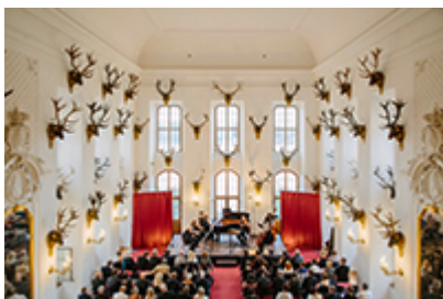
Moritzburg Festival

Una notte fantasmagorica nei parchi dei castelli di Dresda il 21 luglio, il gioiello barocco di Moritzburg si avvolge di celestiale musica dall'11 al 26 agosto, mentre il castello di Proschwitz ospita un concerto con pic-nic nel parco il 12 agosto e la sfavillante Notte Argentina il 17 agosto... Ecco l'estate da favola tra le dimore signorili della Sassonia!