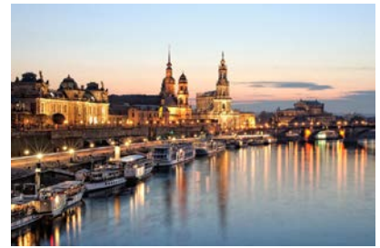
Skyline di Dresda sul fiume Elba