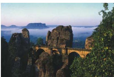
Bastei Brücke nella Svizzera Sassone

Per la prima volta la Sassonia supera i 19 milioni di pernottamenti registrando un totale di 19.513.123 . Il dato statistico, che riguarda le strutture ricettive con più di dieci posti letto, segna una crescita di mezzo milione in più di pernottamenti in Sassonia nel 2017, rispetto ai 18,75 milioni dell'anno precedente. Si tratta di un aumento del 4,1%, mentre è salito a 7.864.001, pari a un incremento del 5%, il numero degli arrivi dei turisti nazionali ed internazionali.