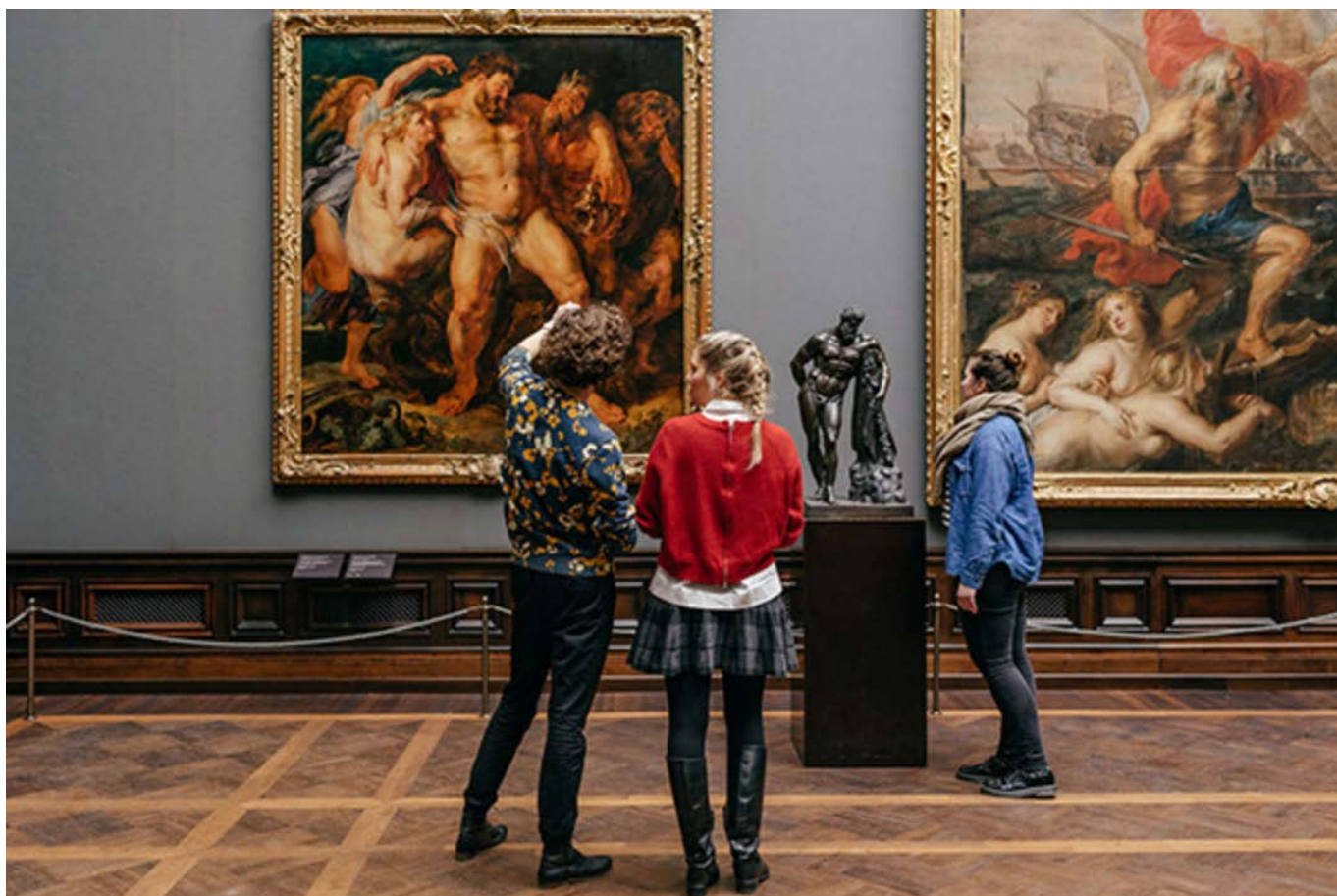
Gemäldegalerie Alte Meister

Da un punto di vista artistico il nuovo anno non sarà da meno. Verso la fine di febbraio è prevista la riapertura della Galleria Semperbau dello Zwinger rimasta chiusa tutto autunno per importanti lavori di restauro. Qui sono esposte le più importanti opere d'arte della Gemäldegalerie Alte Meister come la Madonna Sistina di Raffaello e una magnifica collezione di sculture.