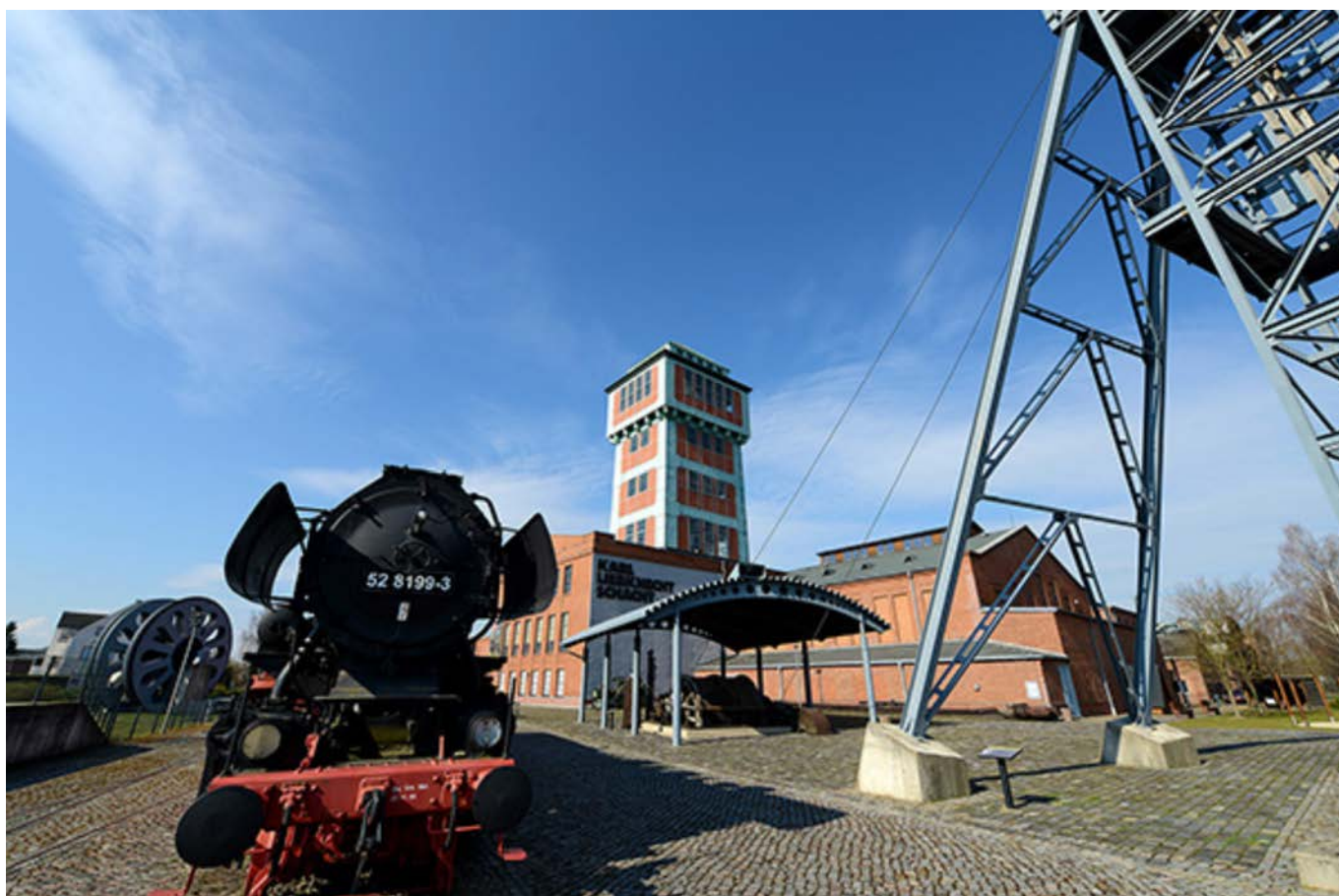
Museo delle miniere a Oelsnitz