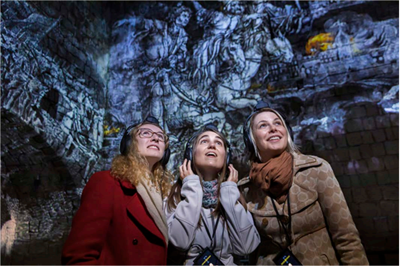
Fortezza di Dresda: spettacolo multimediale: "Splendore. Lacrime. Disastro. Più vicino che mai"

Infine, a settembre 2020 , Schösserland Sachsen porta in scena "Un'eccitante giornata attraverso il tempo", una nuova "Zwinger Xperience". Un viaggio nel passato, all'interno di cinque mondi a tema, per scoprire come lo Zwinger, uno dei monumenti più belli di Dresda sia cambiato nel corso degli anni.