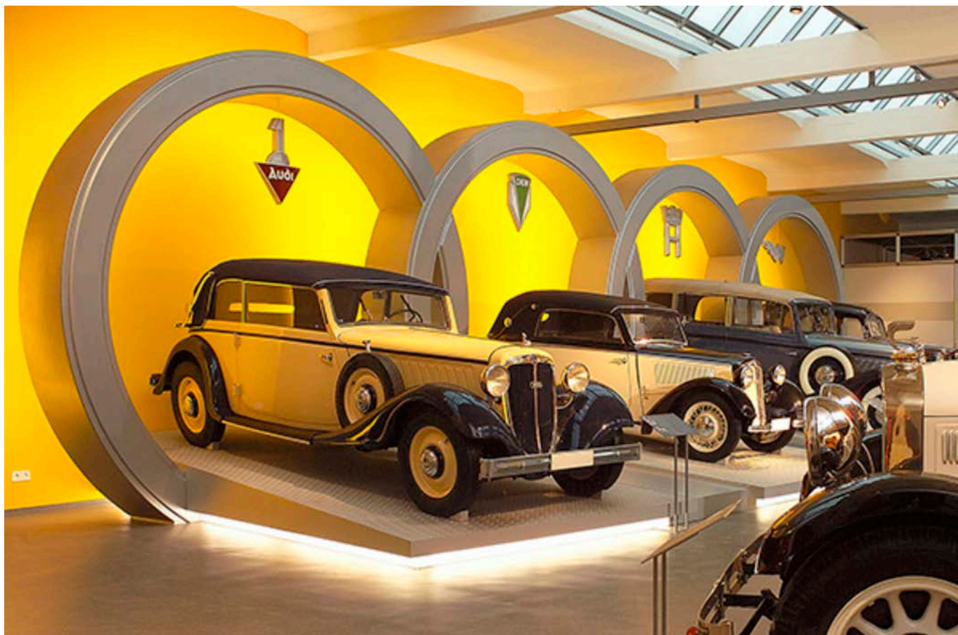
August Horch Museo a Zwickau

dell'Industria di Chemnitz, il Museo delle miniere di Oelsnitz nei Monti Metalliferi, l'August Horch Museo di Zwickau, la miniera di formazione "Reiche Zeche", sede oggi dell'università Tecnica Bergakademie Freiberg e la fabbrica di tessuti Gebrüder Pfau a Crimmitschau. Maggiori informazioni: https://www.boom-sachsen.de/en/ (in inglese)